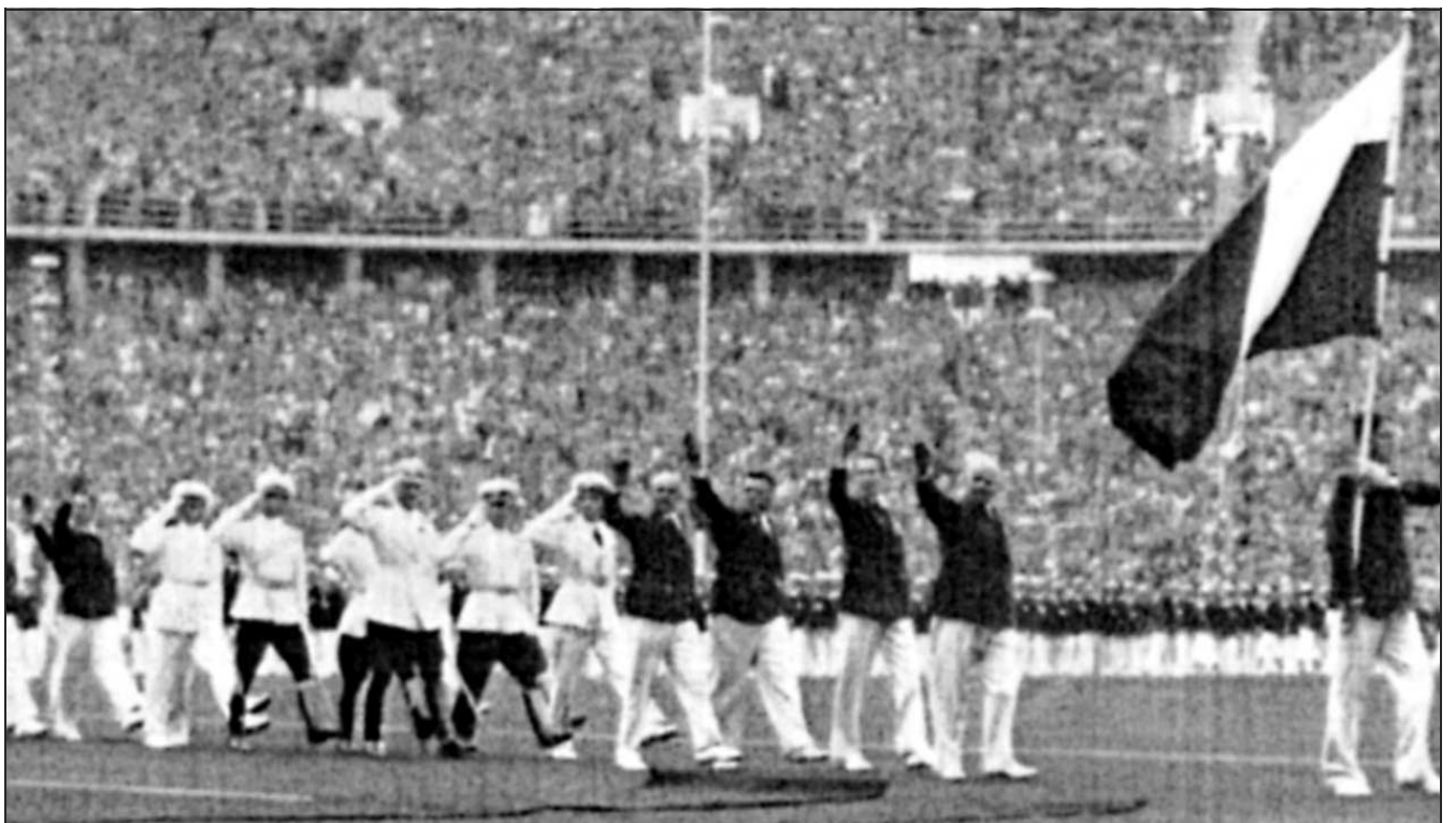
Спортистите от българската делегация на олимпиадата в Берлин дефилират на откриването с вдигнати десни ръце, а офицерите-състезатели отдават чест по войнишки.

Учебния център към Олимпийския музей в Лозана. - Писах писмо на журналиста и му доказах, че това не е хитлеристки поздрав, а традиционният олимпийски привет, който също е с вдигната дясна ръка. Така в Берлин през 1936 година дефилират много делегации, включително и френската.“ ♣