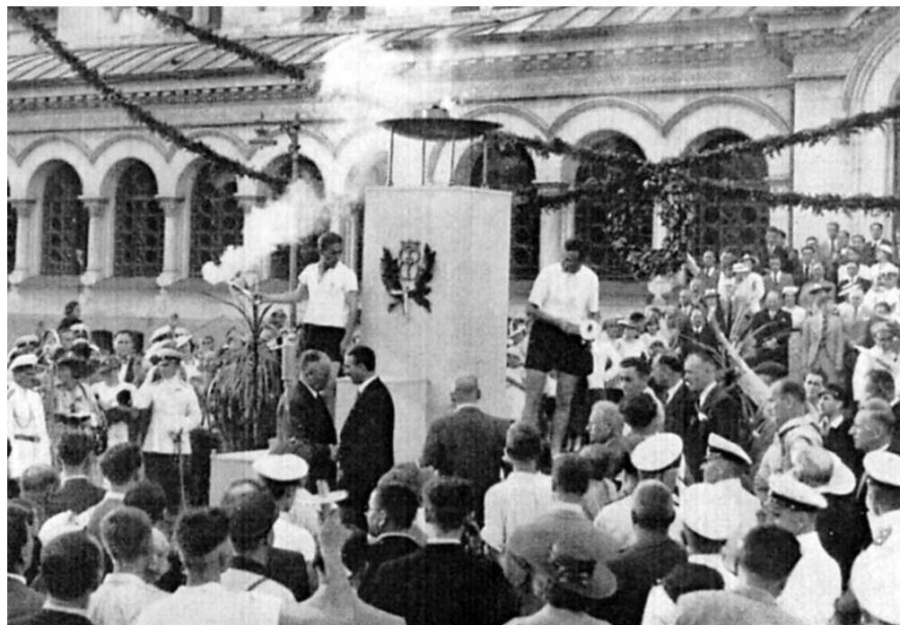
25 юли 1936 г. Церемонията по посрещането на олимпийския огън събира 2000 столичани на площада пред храм-паметника „Александър Невски“.