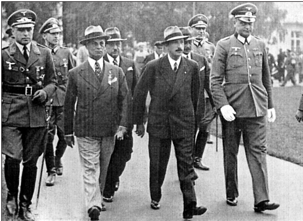
7 август 1936 г. Цар Борис III на посещение в олимпийското село в Берлин. Отляво е Стефан Чапрашиков, членът на МОК от България по това време. Отдясно на монарха е полковник Фон Гилза, комендант на селото.

Организацията в Оли Дорф е безупречна. Всичко искри от чистота, а скъпата храна изобилства по масите на олимпийците. ♣