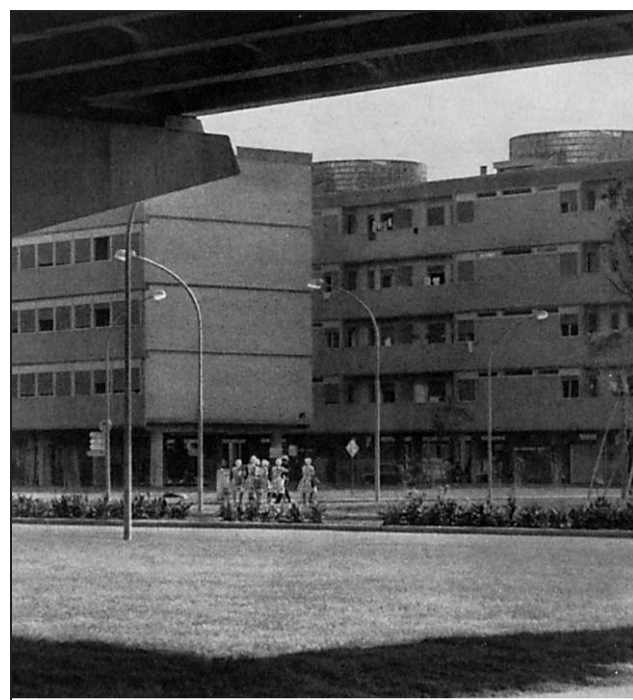
Част от блоковете в Олимпийското село на игрите в Рим през 1960 г. и тревата пред тях, газена умишлено от някои български спортисти. Снимка Архив „Труд“

факта, че като се тъпче тревата в Олимпийското село, се създава повече работа за италианския пролетариат, който пък ще печели повече пари. Солидарност в действие. Домакините няколко пъти протестирали, но някои от нашите спортисти продължили да ходят по тревата вместо по алеите до края на игрите.“ ♦